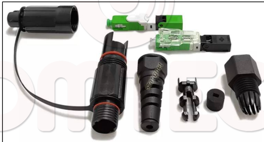
IMAGEN REFERENCIAL ADAPTADOR OPTITAP